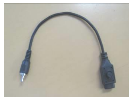
OSD SW ケーブル

注意 本機を分解しないでください。分解により防水性能が保てなくなり、漏水による故障の原因となります。